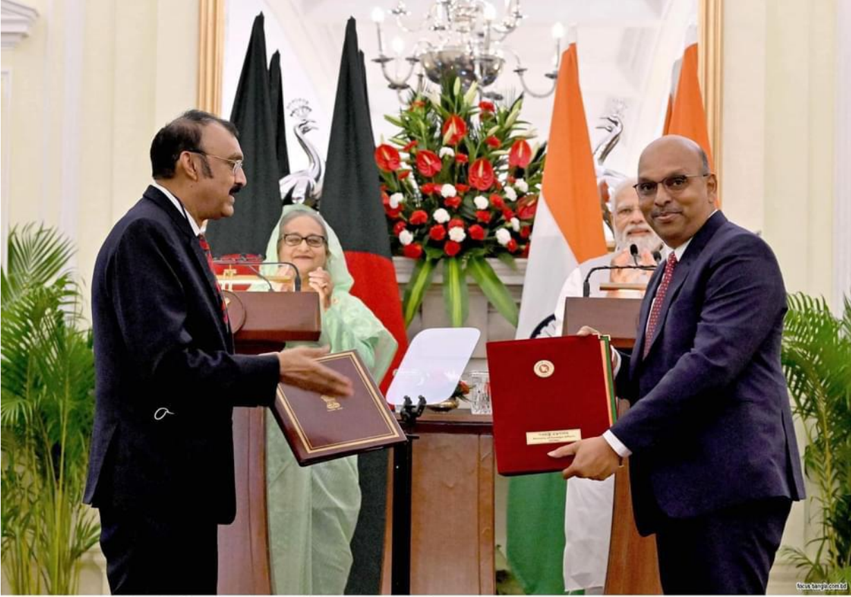
প্রধানমন্ত্রী শেখ হাসিনা ও ভারতের প্রধানমন্ত্রী নরেন্দ্র মোদি উপস্থিতিতে মঙ্গলবার (৬ সেপ্টেম্বর, ২০২২) ন্যাশনালিটির হায়দ্রাবাদ হাউজে দুই দেশের মধ্যে খটি সমঝোতা স্মারক স্বাক্ষর হয়