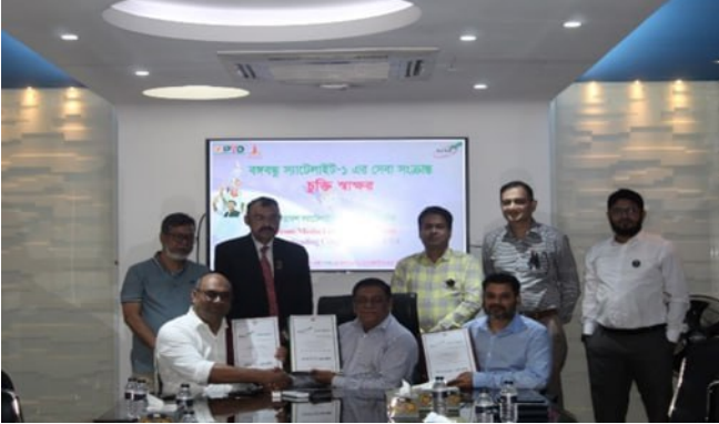
সম্প্রচারের লক্ষ্যে সম্প্রতি এয়ারকম মিডিয়া লিমিটেড ও যুক্তরাষ্ট্র ভিত্তিক অ্যামিকো ট্রেডিং কর্পোরেশনের সাথে বাংলাদেশ স্যাটেলাইট কোম্পানি লিমিটেড (বিএসসিএল) একটি চুক্তি স্বাক্ষর করেছে। এই চুক্তির আওতায় বর্তমানে সনি ও জি-এর বেশ কিছু চ্যানেল বঙ্গবন্ধু স্যাটেলাইট-১ এর মাধ্যমে সম্প্রচারিত হচ্ছে এবং বিএসসিএল বৈদেশিক মুদ্রা আয় করছে।

বাংলাদেশ ডিজিটাল মেলা-২০২৩-এ বাংলাদেশ স্যাটেলাইট কোম্পানি লিমিটেড (বিএসসিএল)- এর অংশগ্রহণ।