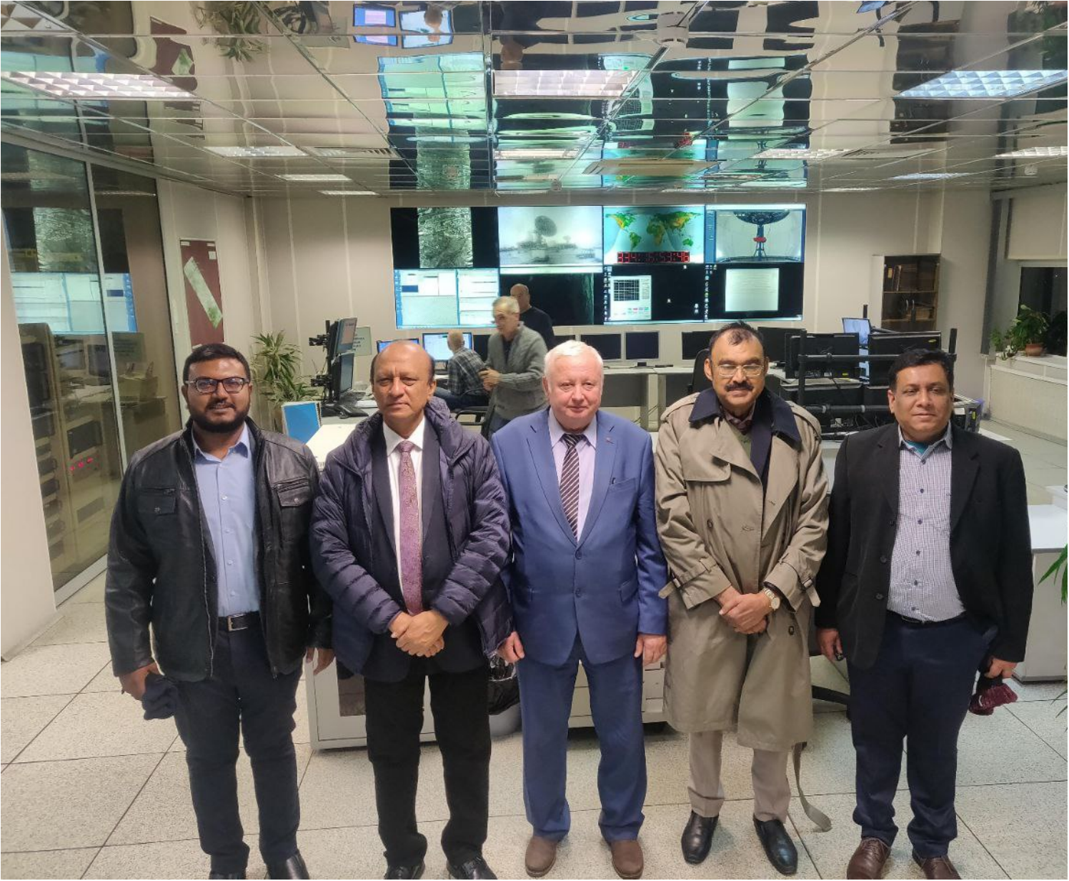
রাশিয়ায় অনুষ্ঠিত "Construction & Launching Bangabandhu Satellite-2" বিষয়ক দ্বিপাক্ষিক সভা