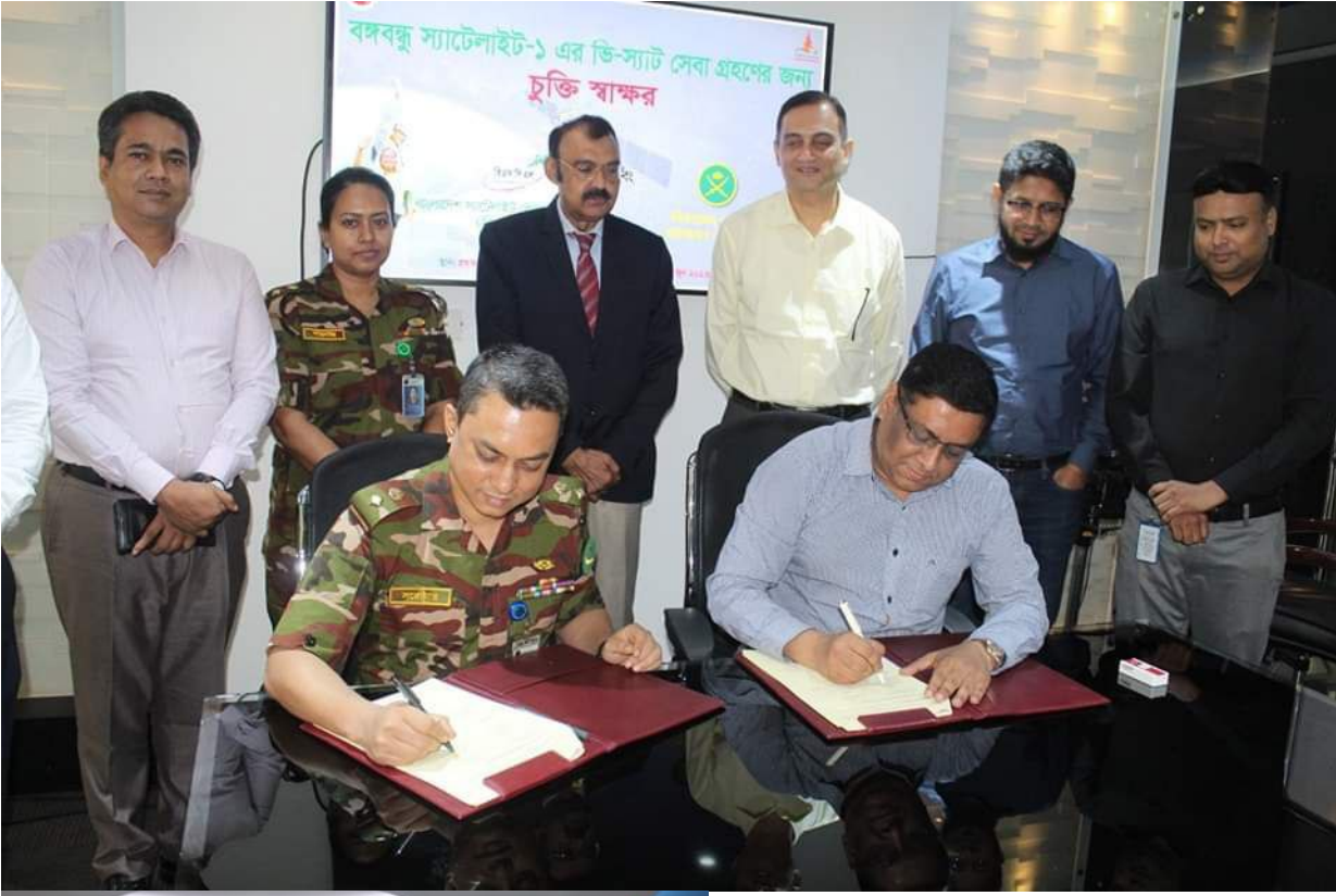
বঙ্গবন্ধু স্যাটেলাইট-১ এর ডি-স্যাট সেবা গ্রহণের লক্ষ্যে বাংলাদেশ সেনাবাহিনীর সাথে বানিজ্যিক চুক্তি স্বাক্ষর করেছে।